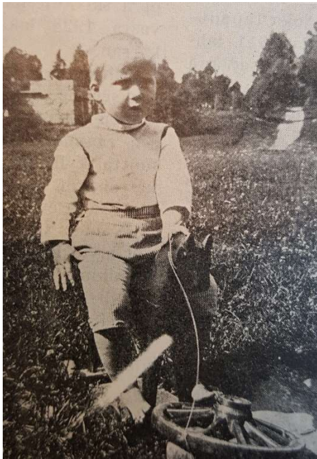
Kuva 1. Ilmari Hannikainen vuonna 1895. 1